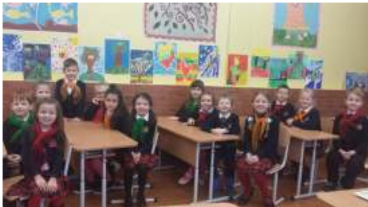
3 pav. Sveikinimas Lietuvai, 1d kl.

direktorius įteikė Padėkos raštus šauniausiems 1-4 klasių mokiniams. Minėjimo metu skambėjo nuotaikingos dainos apie Lietuvą, kurias atliko pradinė klasių mokinių choras, smagiai sukosi poros, savo kūrybos eiles skaitė jaunieji literatai.