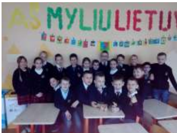
1 pav. Sveikinimas Lietuvai, 3b kl.