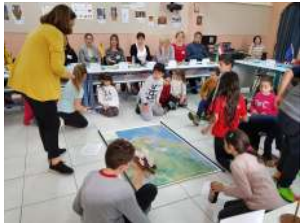
8 pav. Graikijos Rodo 18-osios prad. m-klos mokiniai