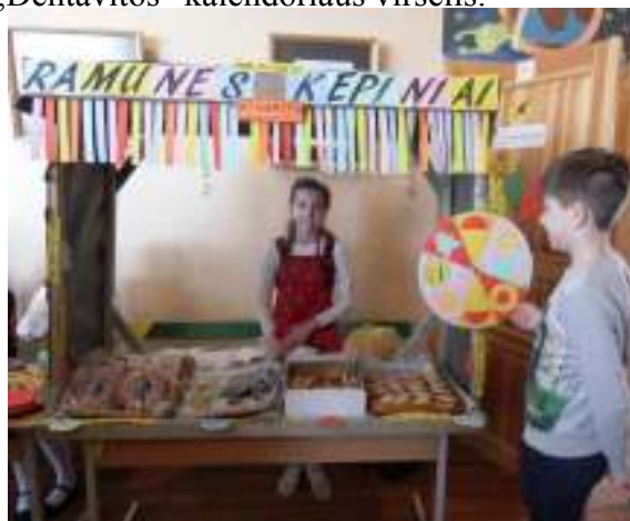
6 pav. 4b klasės jaunoji prekybininkė