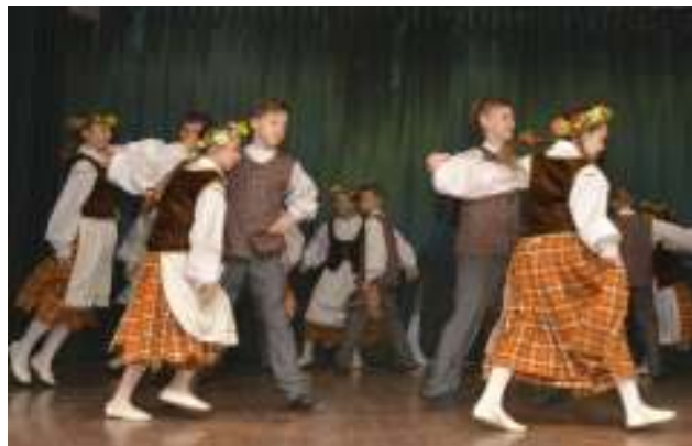
4 pav. Šoka „Mikučiukas“, 4a kl.