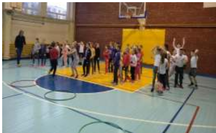
2 pav. Šventinės antroklų estafėčių varžybos