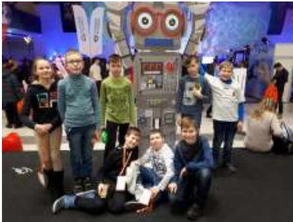
7 pav. Robotiados dalyviai