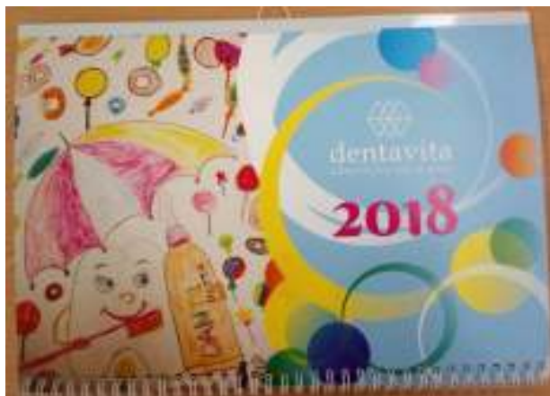
5 pav. „Dentavitos“ kalendorius